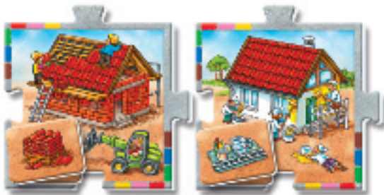
Schritt 5: Das Dach wird gedeckt.

Zeigen Sie Ihrem Kind vorab, wie die Puzzleteile miteinander verbunden werden können. Alle Straßenteile und Baustellen können gedreht und mit Vorder- oder Rückseite nach oben verwendet werden. So findet sich immer das passende Teil.