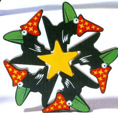
← Karussell Carousel Le carrousel Giostra