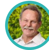
Paul Knoblach Bündnis 90 Die Grünen