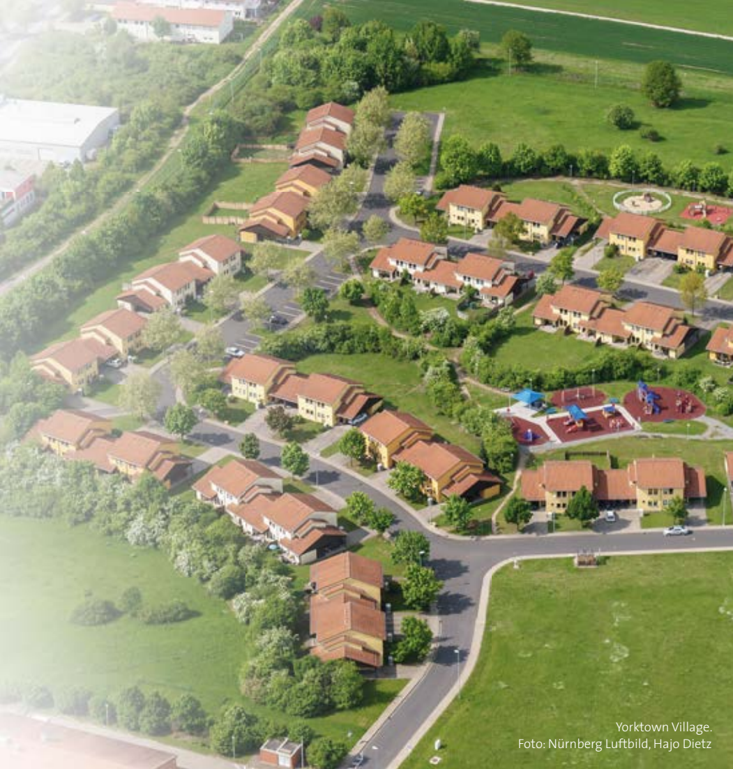
Yorktown Village.