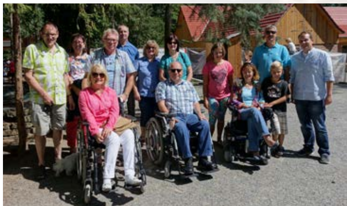
Der Verein organisiert auch Führungen.