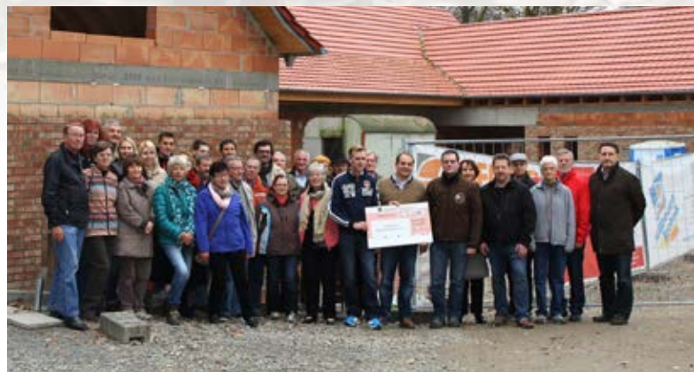
Knapp 20.000 Euro haben die Wildparkfreunde gespendet.