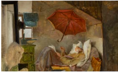
Carl Spitzweg: Studie zu Der arme Poet, Grohmann Museum Collection at Milwaukee School of Engineering, Milwaukee, WI (USA).

„Spitz und Knitz“ nennt sich die Ausstellung, die das Museum Georg Schäfer vom 2. Juli bis 24. September zeigt. Die heiter leichte Sommerausstellung präsentiert rund 100 Werke der Maler Carl Spitzweg und Johann Baptist Pflug, darunter bedeutende Leihgaben (u. a. Braith-Mali-Museum Biberach, Bayerische Staatsgemäldesammlungen München, Staatsgalerie Stuttgart). Aus der Grohmann Museum Collection in Milwaukee/USA kommt Spitzwegs Armer Poet (Ölskizze). Auch die Hauptwerke Carl Spitzwegs, die von März bis Juni an das Leopold Museum in Wien ausgeliehen waren, sind wieder zurück in Schweinfurt.