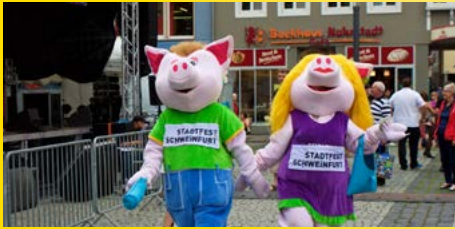
Die Besucher dürfen sich auf viele Aktionen freuen.

Ein Höhepunkt ist der Genussbereich Weinland an der Stadtmauer, wo am Freitag Audiostreet auf der SWG-Bühne auftreten. Im Bierland am Martin-Luther-Platz zeigen die Brauereien ihre Sortenvielfalt. Hier darf geschunkelt werden, unter anderem mit Die Partyräuber und Frankenfieber. Am Georg-Wichtermann-Platz stehen am Samstag Schweinfurt und seine vielen Kulturen im