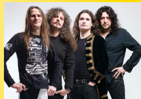
Four Roses.

Vor mehr als sieben Jahren konzipierte die Blues Agency auf Initiative der Werbebegegnungsgemeinschaft Schweinfurt erleben e. V. das Stadtfest neu. Seither hat es sich kontinuierlich weiterentwickelt und bietet auch in diesem Jahr als „Fest der Plätze und Familien“ wieder ein Programm für die ganze Familie. Über die gesamte Innenstadt verteilt gibt es am 25. und 26. August zahlreiche Mitmach- und Sportaktionen, Informationen und Attraktionen. Die Einzelhändler laden zum Bummeln und Shoppen ein und bereichern das Shopping-Erlebnis mit vielen Aktionen und Angeboten.