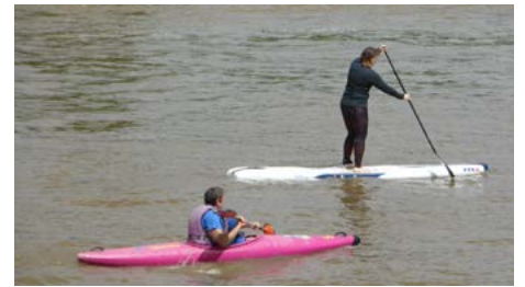
Die Kanuabteilung bietet neuerdings auch die Trendsportart Stand-up-Paddling.

tennisräumen und Bundeskegelbahnen sowie Gaststätte und Gästehaus (beides 1954). Die Investitionen nähmen zu, berichtet der Vorsitzende, zugleich werde die Finanzierung schwieriger. Eine Rundumsanierung wurde von einem Architekten auf rund zwei Millionen Euro geschätzt, „für uns absolut unfinanzierbar“.