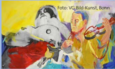
Robert Weissenbacher: Zur Sache Schätzchen, Vol. 2, 2016, Tempera auf Leinwand

Die Kunsthalle Schweinfurt zeigt mit der Ausstellung unter dem Motto „Kraftvolle Passion“ erstmals eine Gegenüberstellung der Werke von Franz Sales Gebhardt-Westerbuchberg (1895–1969) und Leo von Welzen (1899–1967) aus der Sammlung Hierling. Ihre Werke, die bis zum 22. Oktober zu sehen sind, werden nicht nur thematisch anhand ihrer Leidenschaften und religiösen Themen wie der Passion Jesu Christi miteinander verglichen, sondern auch aufgrund der Art und Weise, wie die Künstler diese bildnerisch unverkennbar umsetzen. Um dem Besucher den Wirkungskreis der Künstler zu veranschaulichen, wird die Ausstellung im kleinen Kabinett der Dauerpräsentation im Vorraum erweitert. Zum einen bereichern klassische Chiemseebilder des Museums Georg Schäfer, zum anderen moderne Chiemsee-Interpretationen der Sammlung deutsche Kunst nach 1945 der Kunsthalle die Ge-