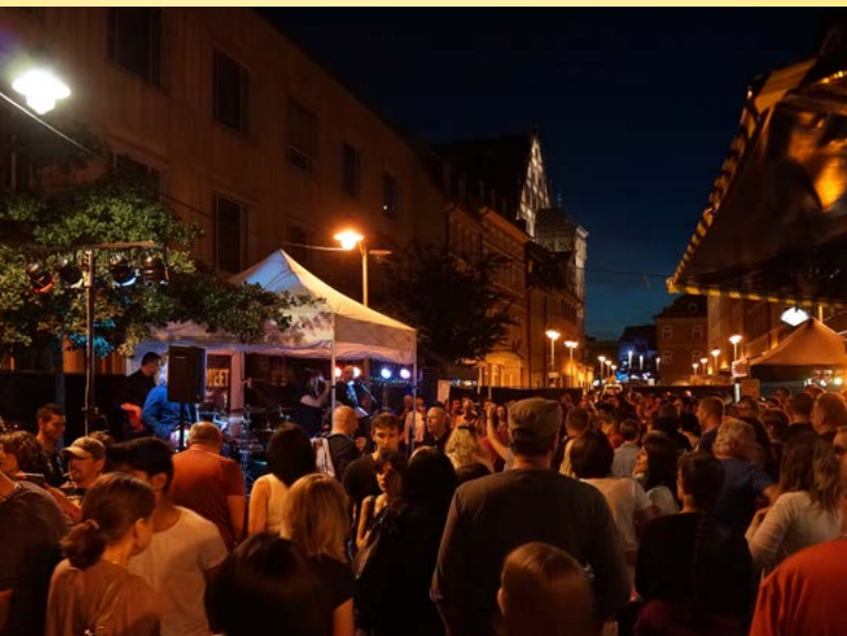
Am 1. Juli findet das Jubiläumsfestival statt.