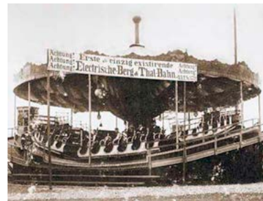
Die erste elektrische „Berg- und Thalbahn“ sorgte 1911 für Aufsehen.

sens. Ein Jahr später wurde das Volksfest erstmals auf dem gleichnamigen neuen Platz an der Niederwerrner Straße eröffnet. Größere Fahrgeschäfte konnten hier problemlos aufgestellt werden. Platz und Angebot sagten allen zu und die Schausteller- und Besucherzahlen stiegen stetig an. Wegen eines Massenbesuchs am 16. Juni 1969 ging im Festzelt sogar das Bier aus. 850 Hektoliter wurden in jenem Jahr getrunken – ein Rekord, der bis heute Bestand hat.