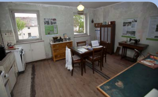
Blick in Esszimmer/Küche.