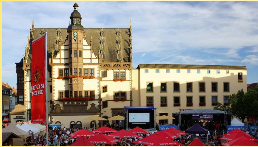
Ende August feiern die Schweinfurter zwei Tage ihr Stadtfest, unter anderem auf dem Marktplatz.

Auf der Stadtwerke-Schweinfurt-Bühne am Marktplatz erwartet die Gäste ein Programm mit Musik, Interviews, Quiz und Aktionen. Am Samstagnachmittag verleiht „Schweinfurt erleben“ wieder das „Goldene Schörschle“ – ein Preis für besonders gelungene Fassaden- oder Außengestaltung in der Innenstadt. Am Abend verwandeln Bands wie Four Roses und Soul7ven den Marktplatz in eine große Tanzfläche.