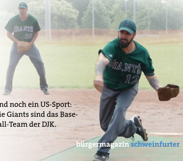
Und noch ein US-Sport: Die Giants sind das Baseball-Team der DJK.