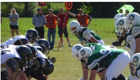
Seit 2016 wird American Football bei der DJK gespielt.

Einige Sportarten aus der Gründerzeit werden immer noch betrieben, allen voran Turnen (nach wie vor die größte Abteilung), jedoch kein Schlagball und Handball mehr. Der Wandel war ein ständiger Begleiter der DJK, die schnell zum beliebten Verein avancierte. Ihren Status als zweitgrößter Turn- und Sportverein in der Stadt hat sie bis heute behalten, auch wenn es nur noch 1.500 Mitglieder sind – und nicht mehr wie zu Spitzenzeiten fast doppelt so viele. Immerhin sind zuletzt knapp 200 neue Mitglieder hinzugestoßen.