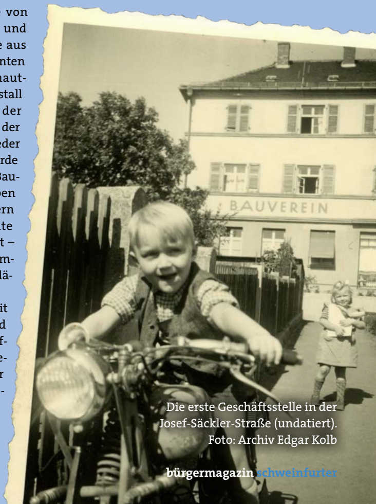
Die erste Geschäftsstelle in der Josef-Säckler-Straße (undatiert).