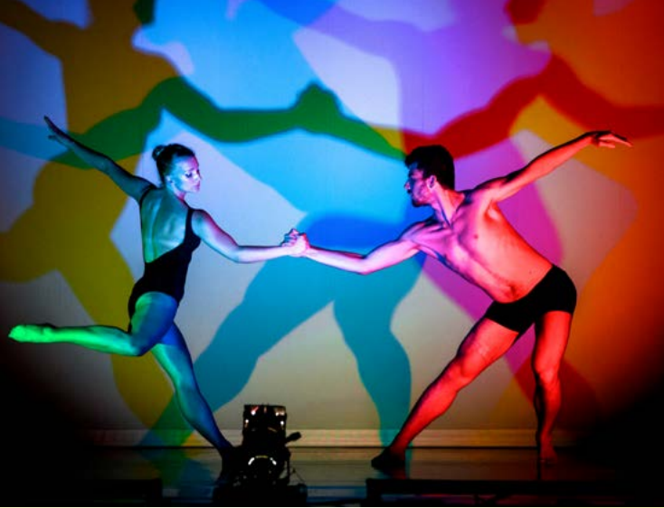
eVolution dance theater.