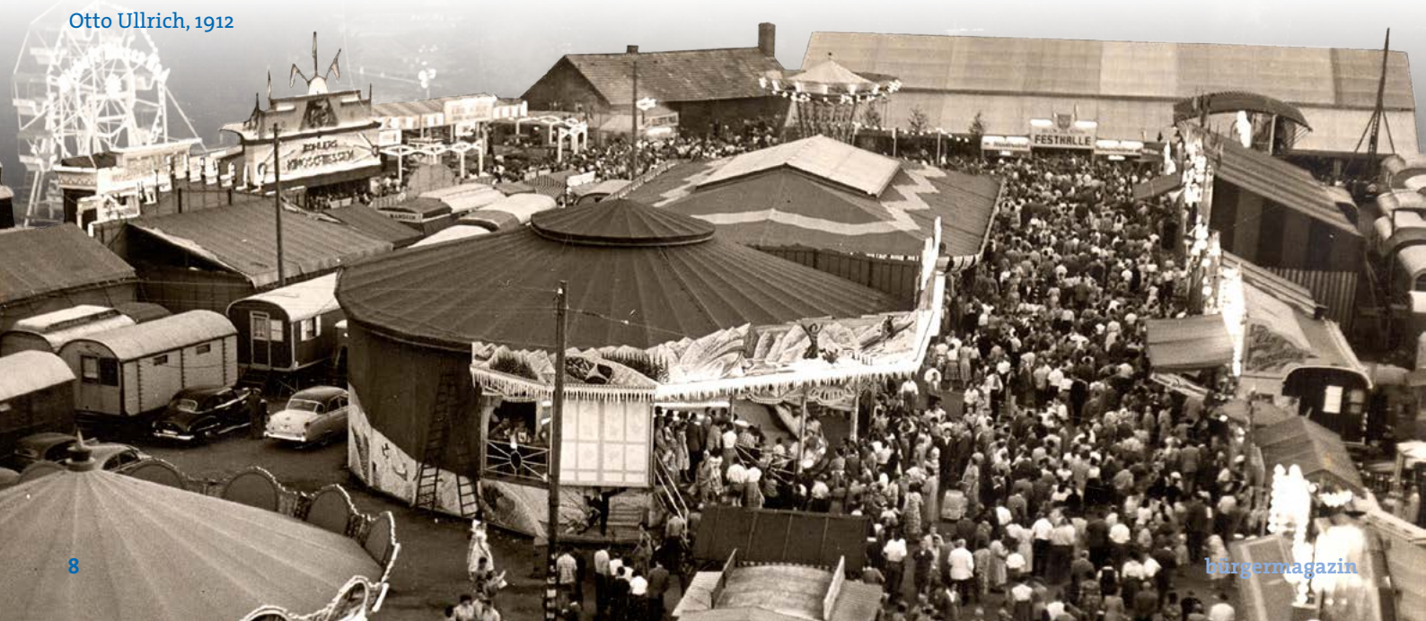
Der alte Festplatz am Bleichrasen (undatierte Aufnahme).