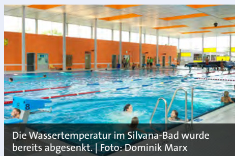
Die Wassertemperatur im Silvana-Bad wurde bereits abgesenkt. | Foto: Dominik Marx

Sollte es wirklich einmal einen Engpass geben, existieren dafür verschiedene Notfallkonzepte. Bei der Gasversorgung ist durch die Bundesnetzagentur geregelt, dass Haushaltskunden sowie Strom- und Wasserversorger oder Alten- und Pflegeheime besonders geschützt sind. Dezentral ist dagegen das Vorgehen bei einer Strommangellage geregelt: Stromversorger oder größere Verbraucher, auch Krankenhäuser, verfügen über eigene Notfallkonzepte. So müssen zum Beispiel die Stadtwerke als Netzbetreiber in erster Linie auf die Netzstabilität achten.