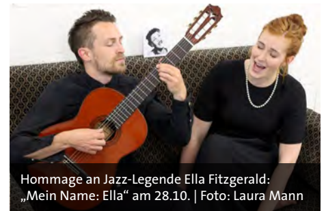
Hommage an Jazz-Legende Ella Fitzgerald: „Mein Name: Ella“ am 28.10.

Bis Februar sind drei Tanzproduktionen zu erleben, zwölfmal Musiktheater und Musicals, neun Konzerte, 18 Schauspiele und acht Kinder- und Jugendtheatervorstellungen. Hier gibt es eine weitere Premiere: In den Herbstferien bietet das Theater erstmals Workshops für Jugendliche im Museum Otto Schäfer an („Beatboxing“ und „Schreib Deinen Song“). Das Programm der zweiten Spielzeit-Hälfte (März bis Juni 2023) wird bis Anfang Dezember bekanntgegeben.