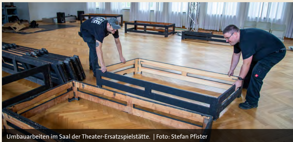
Umbauarbeiten im Saal der Theater-Ersatzspielstätte.

Als dritte Bühne dient das Museum Otto Schäfer in der Judithstraße. Besonders für kleinere Formate wird es genutzt, beispielsweise am 3. Januar für das „Walking Neujahrskonzert“, bei dem man Konzert