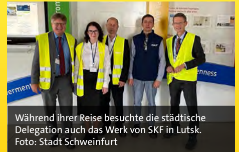
Während ihrer Reise besuchte die städtische Delegation auch das Werk von SKF in Lutsk.

Remelé: Lutsk wünscht, die Solidaritätspartnerschaft in eine dauerhafte Städtepartnerschaft zu überführen. Nicht nur wegen des Krieges, sondern weil man den Blick nach Westen richten möchte. Ich hat-