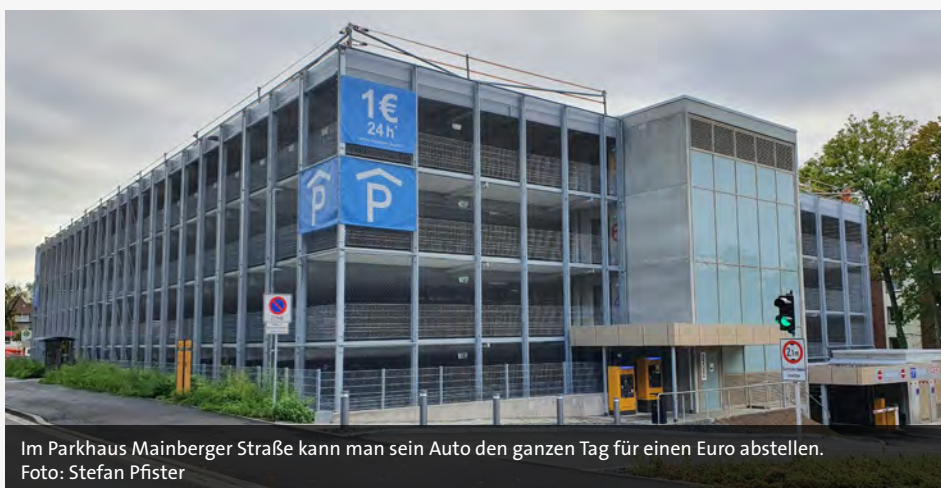
Im Parkhaus Mainberger Straße kann man sein Auto den ganzen Tag für einen Euro abstellen.

Sonderaktion im Parkhaus an der Mainberger Straße.