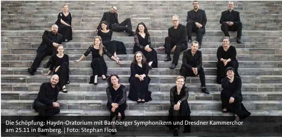
Die Schöpfung: Haydn-Oratorium mit Bamberger Symphonikern und Dresdner Kammerchor am 25.11 in Bamberg.

erste Hälfte der Premieren-Spielzeit von Dr. Christof Wahlefeld in Schweinfurt. Er serviert dem Publikum ein Menü aus Bewährtem und Neuem. Beliebtes wie Dornröschen als Ballett mit der Musik von Tschaikowsky (14./15.12) darf dabei nicht fehlen. Mutig findet er selbst die „Merry Fucking Christmas Party“ (16.12) im Museum Otto Schäfer. Der neue Theaterleiter will neue Akzente setzen, um auch jüngere Publikumsschichten anzusprechen. „Ich hoffe, dass dieser Schwung ankommt und wünsche mir eine Offenheit und Neugier, nicht nur aufs neue Haus, sondern auch