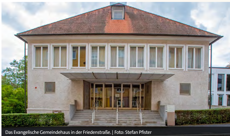
Das Evangelische Gemeindehaus in der Friedenstraße.

Man baue hier ein Theater, das während der gesamten Sanierungsphase Bestand hat. Logistisch wie finanziell sei das von Vorteil. „Wir müssen nicht dauernd die Spielstätte wechseln, auf-, ab- und wieder aufbauen. Sondern können hier fast alles machen, was man auch im großen Haus gewohnt ist.“ Rund 80 Prozent der Aufführungen sind problemlos im neuen Haus möglich. Ein kleiner Rest allerdings nicht, weil ein Orchestergraben fehlt. Das betrifft die großen Opern und Konzerte großer Ensembles, zum Beispiel die Bamberger Symphoniker. Sie werden nicht im Gemeindehaus stattfinden können.