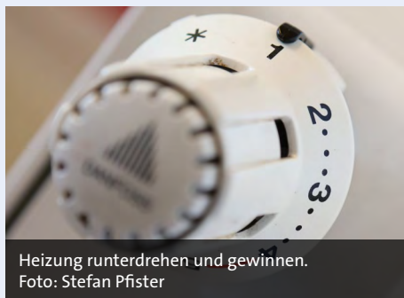
Heizung runterdrehen und gewinnen.

einzusparen. Schon das eine Grad weniger Raumtemperatur ermöglicht Gaseinspa-