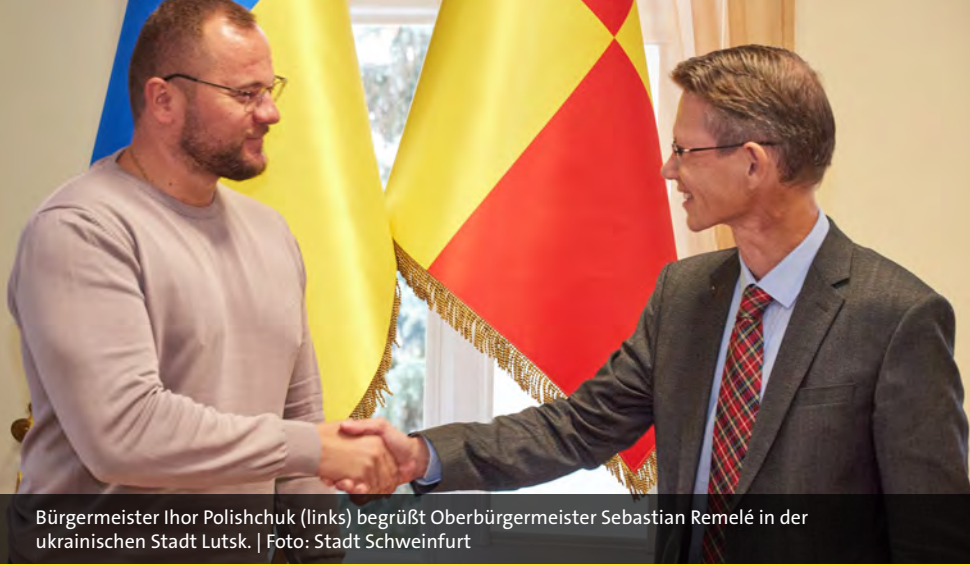
Bürgermeister Ihor Polishchuk (links) begrüßt Oberbürgermeister Sebastian Remelé in der ukrainischen Stadt Lutsk.

Würden Sie die Stadt bitte kurz beschreiben.