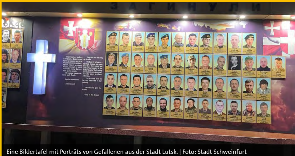
Eine Bildertafel mit Porträts von Gefallenen aus der Stadt Lutsk.