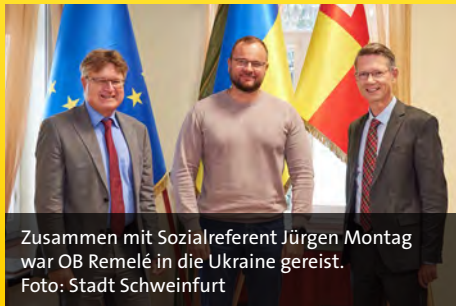
Zusammen mit Sozialreferent Jürgen Montag war OB Remelé in die Ukraine gereist.

Remelé: Es ist eine Großstadt mit über 200.000 Einwohnern, mit einem überschaubaren Stadtkern, gleichwohl einem Theater mit eigenem Ensemble, einer historischen Burganlage, in dem ein Museum mit einer stattlichen Gemäldesammlung untergebracht ist, zwei Hochschulen und einer industriellen Prägung, die von den Eckdaten sehr gut zu Schweinfurt passt.