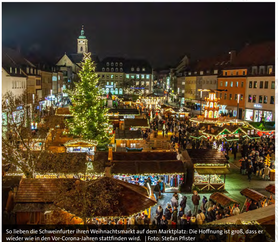
So lieben die Schweinfurter ihren Weihnachtsmarkt auf dem Marktplatz: Die Hoffnung ist groß, dass er wieder wie in den Vor-Corona-Jahren stattfinden wird.