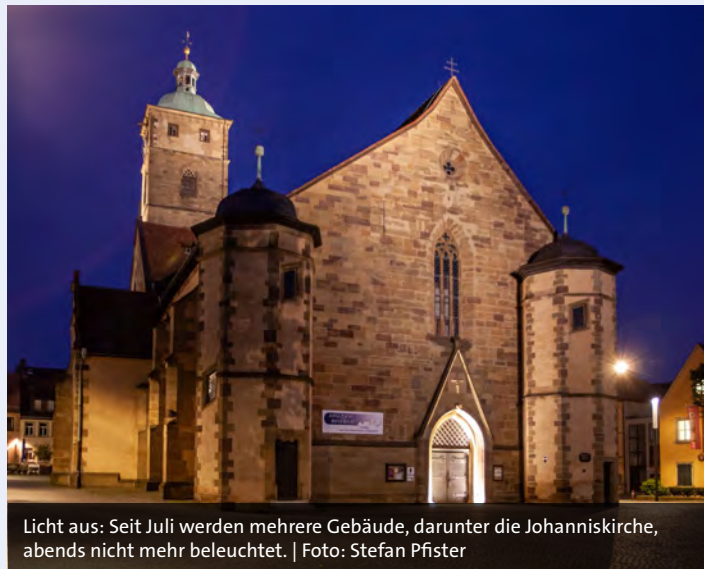
Licht aus: Seit Juli werden mehrere Gebäude, darunter die Johanniskirche, abends nicht mehr beleuchtet.

gust beendete die Stadt den Betrieb fast aller Planschbecken und Brunnen vorzeitig. Die Raumtemperaturen in Aufenthaltsräumen der städtischen Verwaltung und Schulen sind seit der Heizperiode auf 20 Grad abgesenkt. In den Schwimmbädern der Gartenstadt- und Kerschensteiner-Schule ist das Wasser 26 statt 28 Grad warm. Die Stadtwerke als Betreiber des Silvana-Bades haben die Temperaturen im Sport- und Nichtschwimmerbecken ebenfalls um zwei Grad abgesenkt und Sauna und Außenwarmbecken geschlossen. „Wir sind grundsätzlich gut versorgt und es gibt keinen Grund, Panik zu verbreiten. Es ist aber geboten, zu überlegen, wo man Energie einsparen kann. Unser Vorstoß soll auch Bürgerinnen und Bürgern, gewerblichen und institutionellen Betreibern ein Anstoß sein, über den Energieverbrauch nachzudenken“, so OB Remelé.