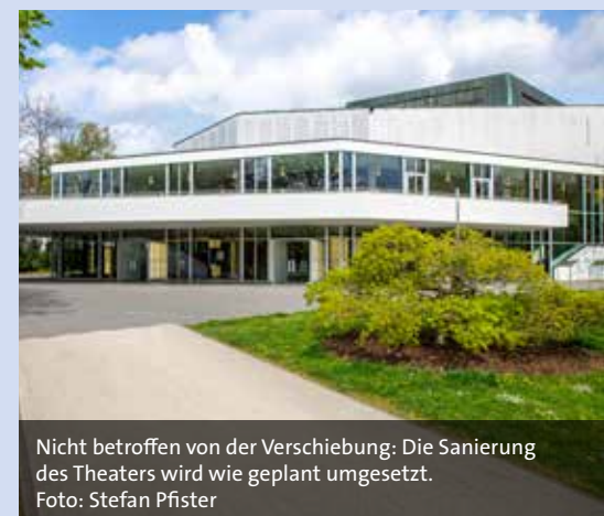
Nicht betroffen von der Verschiebung: Die Sanierung des Theaters wird wie geplant umgesetzt.

Großbetriebe wieder Steuern zahlen, ist ungewiss. Aktuell ist es nur einer von fünf. Nicht alle Fraktionen und Gruppierungen stimmten der neuen Haushaltssatzung für das Jahr 2023 zu. Von den 41 in der Stadtratssitzung Ende November anwesenden Stadträten lehnten zwölf Mitglieder das Zahlenwerk ab, darunter die Fraktionen von SPD und Freie Wähler, sowie FDP und Zukunft./ÖDP. Pro Haushalt votierten 29 Stadträte von CSU, Bündnis 90/Die Grünen, AfD und Die Linke.