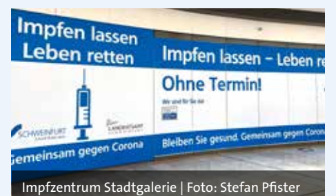
Impfzentrum Stadtgalerie

stellen für Bürger ein. Sie befinden sich im Rathaus, in der Kerschensteiner-, Auen- und Albert-Schweitzer-Schule. Weitere Informationen dazu unter www.schweinfurt.de/krisenvorsorge .