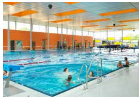
Energiesparen im Silvana | Foto: Dominik Marx

Die Stadt Schweinfurt geht eine kommunale Klimapartnerschaft mit der Stadt Tarija in