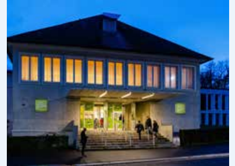
Das Ev. Gemeindehaus

Söder teilnimmt. Sie heißt künftig Technische Hochschule (THWS).