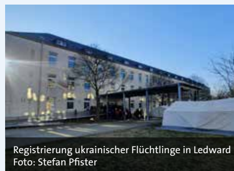
Registrierung ukrainischer Flüchtlinge in Ledward

Für den bereits am 2. Dezember 2020 verstorbenen Ehrenbürger und Oberbürgermeister a.D. Kurt Petzold wird eine Gedenk-