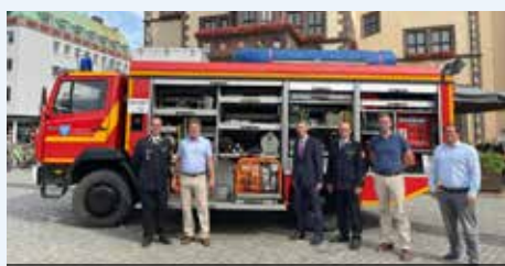
Übergabe des Feuerwehrautos für Lutsk

Im Rahmen der Solidaritätspartnerschaft mit Lutsk in der Ukraine spendet die Stadt Schweinfurt einen Feuerwehr-Rüstwagen. Aufgrund diverser Neuanschaffungen sollte