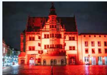
Lichtaktion Corona

Auf Initiative der Kommunalen Jugendarbeit installiert die Stadt legale Flächen zum Sprayen. Die „Graffitiwürfel“ befinden sich