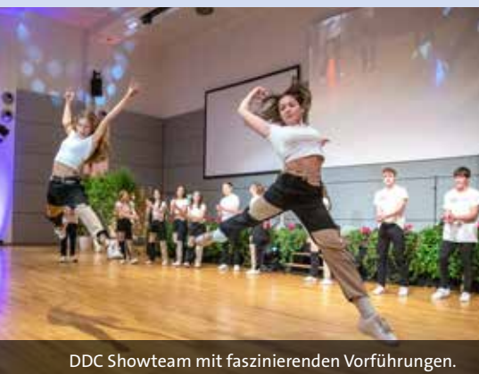
DDC Showteam mit faszinierenden Vorführungen.

meinte er einmal: „Wenn du mich 1986 ebenfalls zur WM mitgenommen hättest, dann wären wir damals auch Weltmeister geworden.“