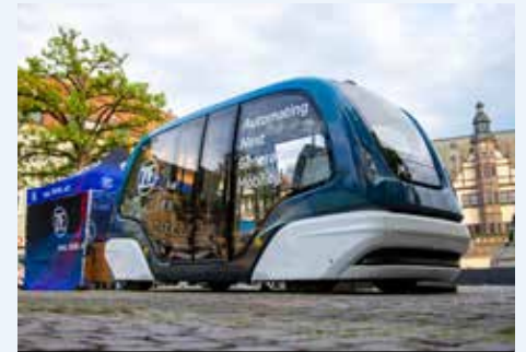
Präsentation des autonom fahrenden Shuttle von ZF