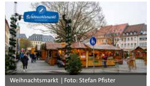
Weihnachtsmarkt