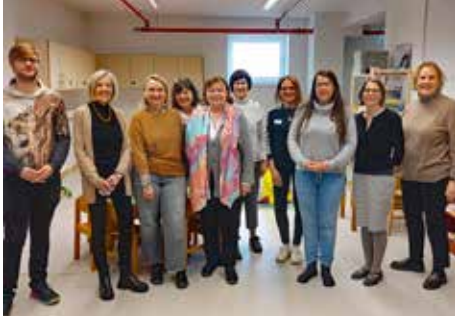
Kinderhaus in Ledward: SkF Vorstand und Mitarbeiterinnen

Für die Betreuung ukrainischer Kinder wird ein Kinderhaus in Ledward eröffnet, das